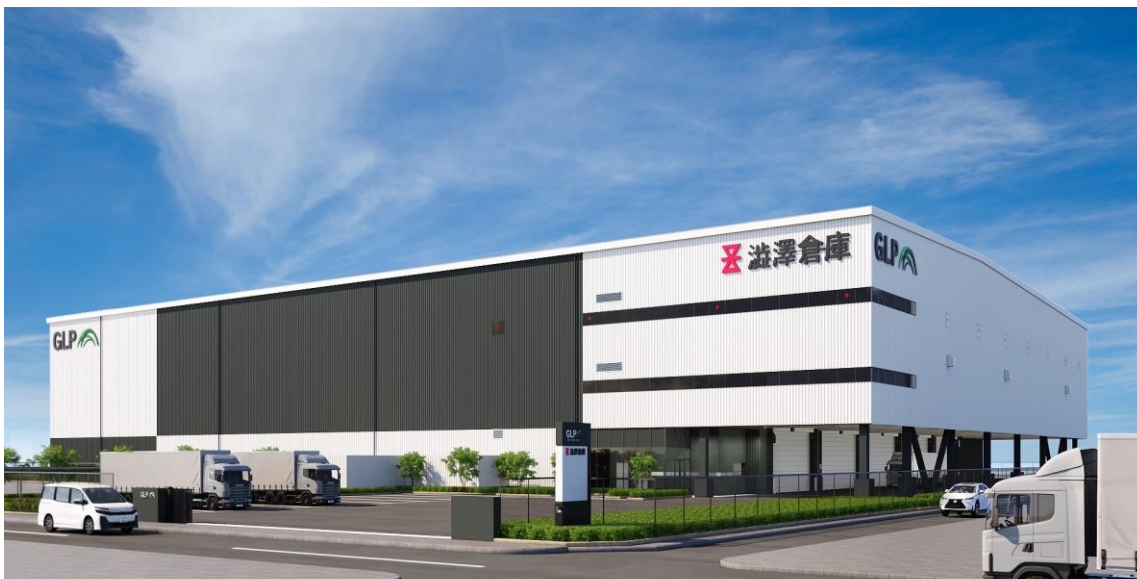
新拠点完成イメージ